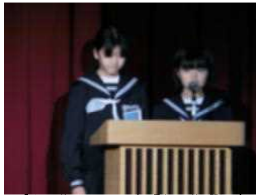
『ペットボトルロケット～水の量と飛距離の関係～』

この文化祭で学んだことは「男女の一体感」「クラス一人一人の本気」「表情の豊かさ」「成功の陰にはだれかがいる」ということです。この4つのことを胸に学校生活に生かしていきたいと思えます。(1組男子)