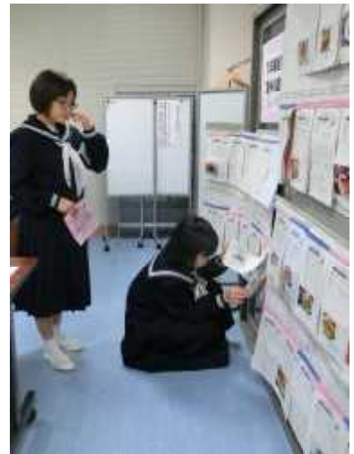
家庭科 夏休み課題「家族の食事レシピ」