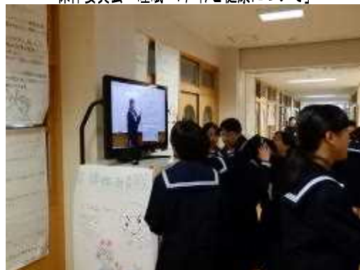
保体委員会「睡眠・マイイと健康について」