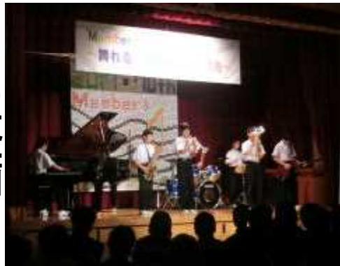
『イケメン七重奏』 (音楽演奏)

僕は文化祭を通して「一生懸命」を学びました。特に3年生から一生懸命さが伝わってきてカッコよかったです。自分も3年生たちみたいになれるよう努力していきたいです。(1組男子)