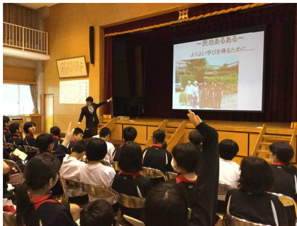
「民泊あるある」でマナーやルールについても ぼっちり！！