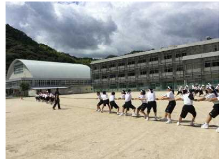
団体種目「きみのなわ 2018」

8月30、31日に夏休み明けテストがありました。テストの前に子ども達に、勉強してきてくれたか。をたずねると、「宿題を終わらせるので精一杯だった」、「遊びとゲームで勉強が出来なかった」という声が多くありました。中学生活にならなうと初めだっ長いと、宿題の中で立っかると大計画を立て、思いつく勉強でいきな力が中学生には必要です。計画的に勉強できな人も、家で勉強しな人も、次回は勉強に部活に遊びにと充実した休みを過ごせるように頑張りたいですね。