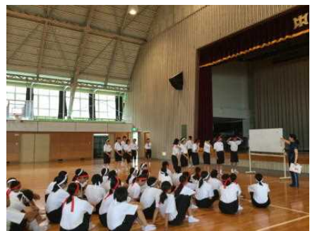
学年種目「ぱんがないって!」